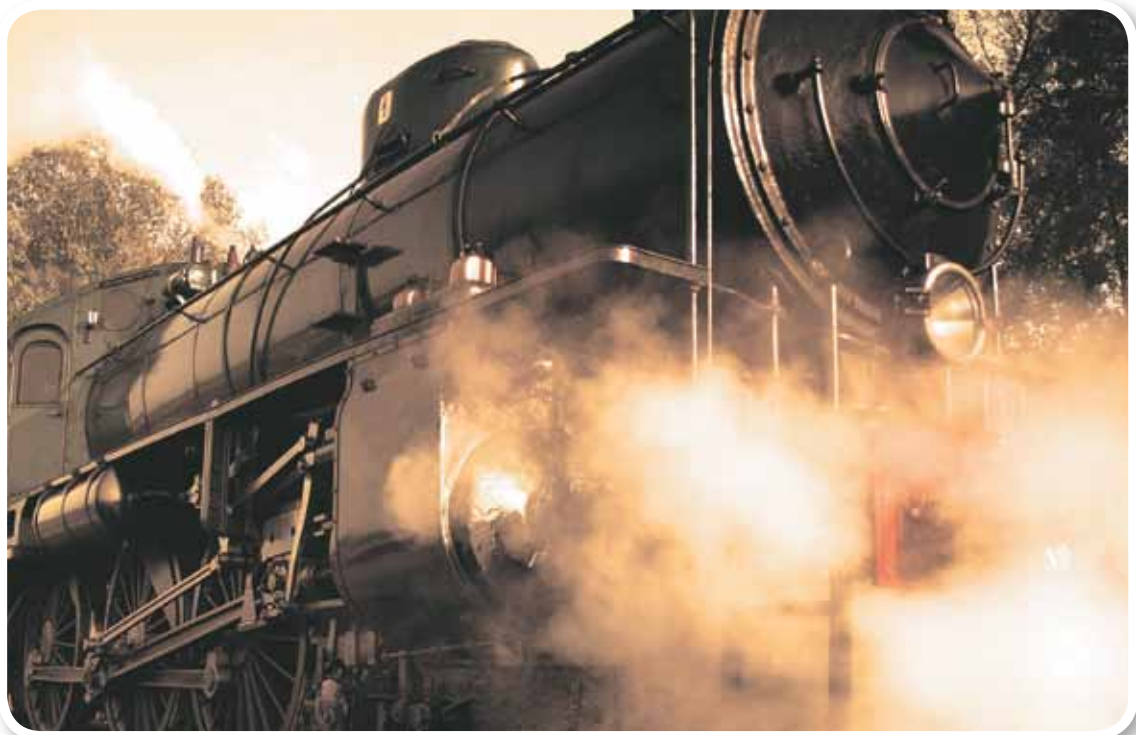
Tren de vapor, Revolución Industrial.

En este desarrollo de la industria, las colonias de América jugaron un papel importante, ya que el oro y la plata de las colonias americanas fueron la base para el desarrollo industrial de Europa.