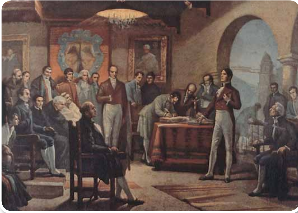
Firma del Acta de Independencia en el Cabildo de Santa Fe, el 20 de julio de 1810.