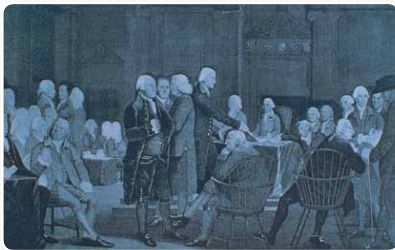
El Congreso de los Estados Unidos vota la independencia del Imperio Inglés.